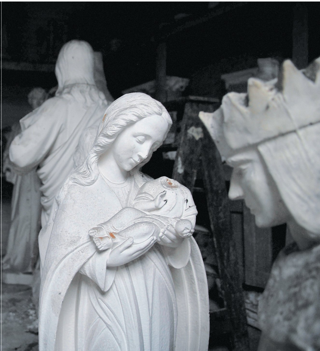
Gipsen heiligenbeelden in de (gesloten) Sint Joseph Beeldenfabriek in Venlo.